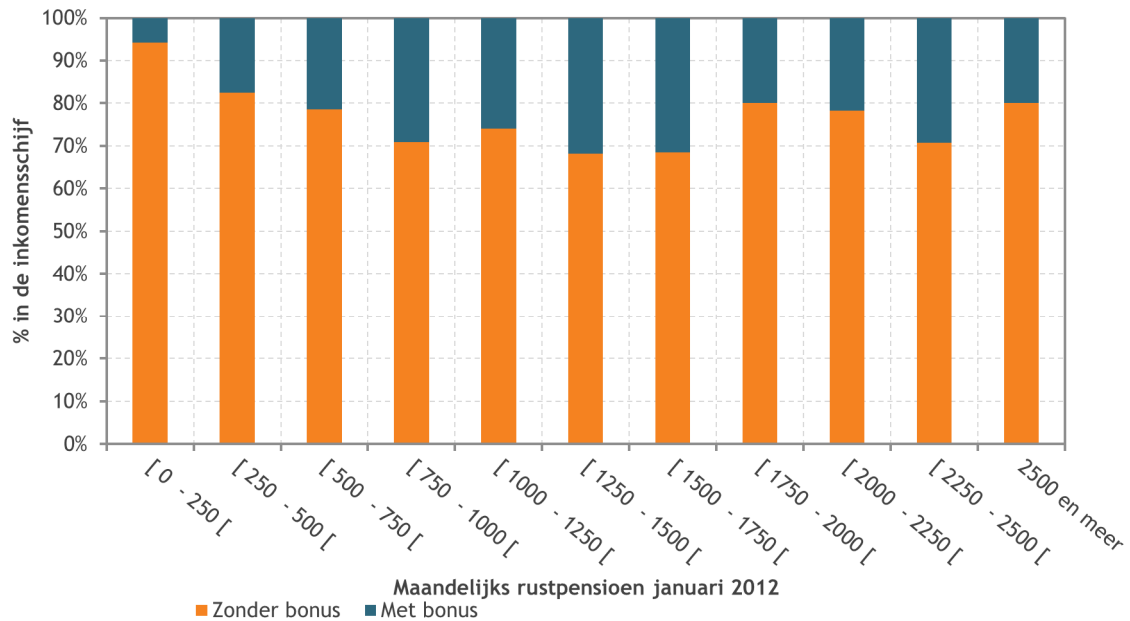
Figuur 3 Verdeling van de nieuwe rustpensioen al naargelang de toekenning van een pensioenbonus per inkomensschijf (rustpensioen)